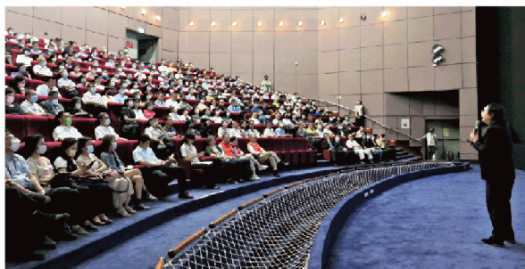
專題演講、全球視訊會議