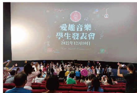
音樂饗宴、成果發表