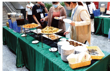
特展下午茶、特展之夜