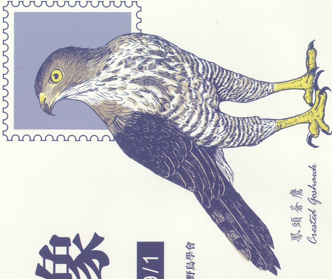
鳳頭蒼鷹 Crested Goshawk