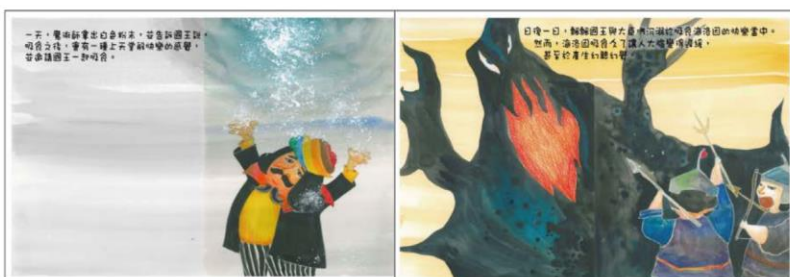
※範例作品：教育部反毒繪本—飄飄王國滅亡記/洪孟真、呂舒婷